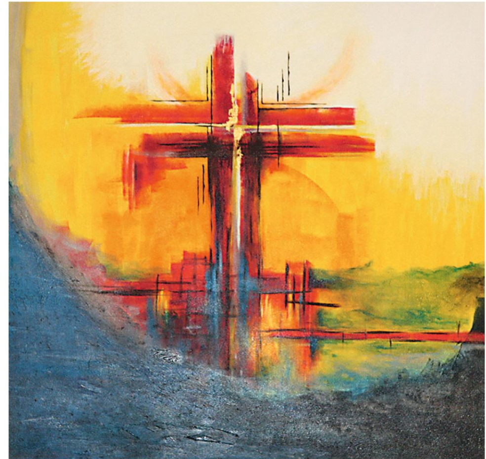
Auferstanden vom Tode, Christine Hartmann/Atelier 14, Altargemälde. Ausschnitt aus einem Triptychon, Kreuzkirche, Fulda, Bild: Hartmann/www.Atelier14Fulda.com

Von der Auferstehung her leben – das heißt doch Ostern.